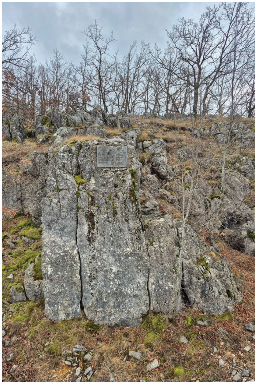
Сйомен ѓлоча у Продоли.