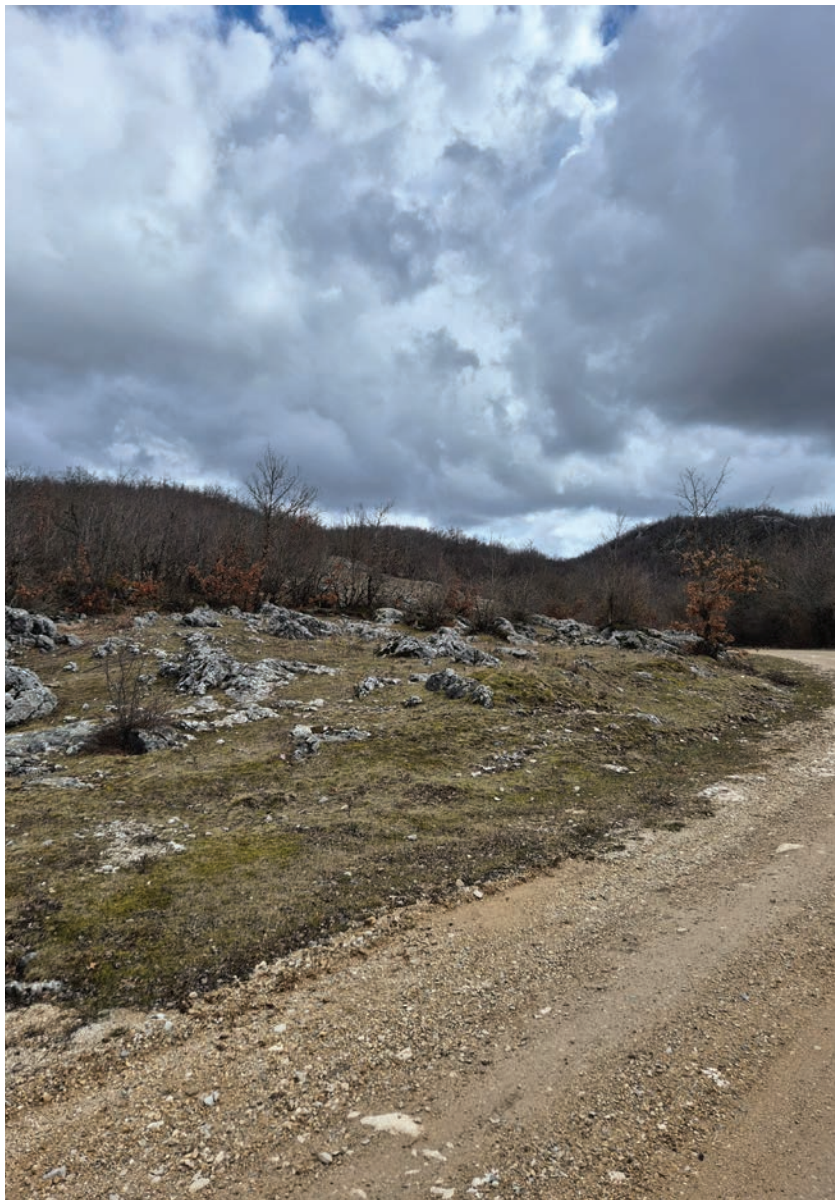
Пољана на уласку у Раковски кланац - мјесто убиства поручника Берића.