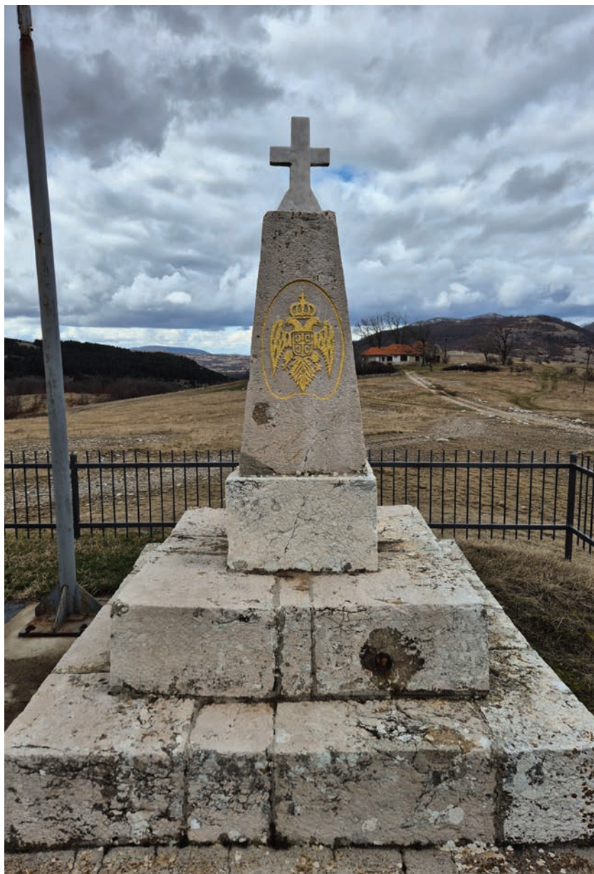
Сјоменик Краљу Пејтру I Ослободиоцу на Горњој Трусини.