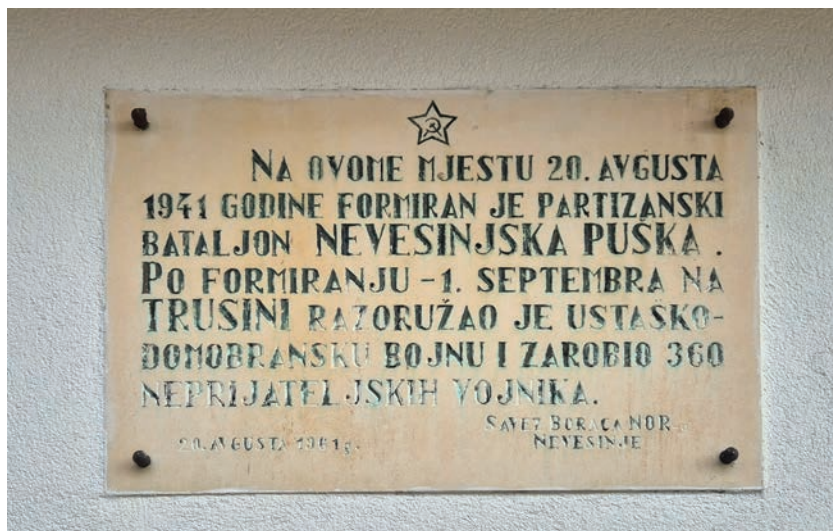
Сйомен ѿлоча на Основној школи у Зовом Долу.