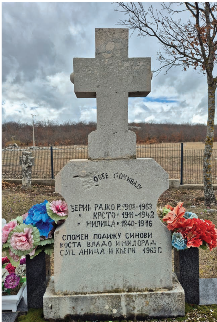
Сјоменик у гробљу у Мокром Долу.