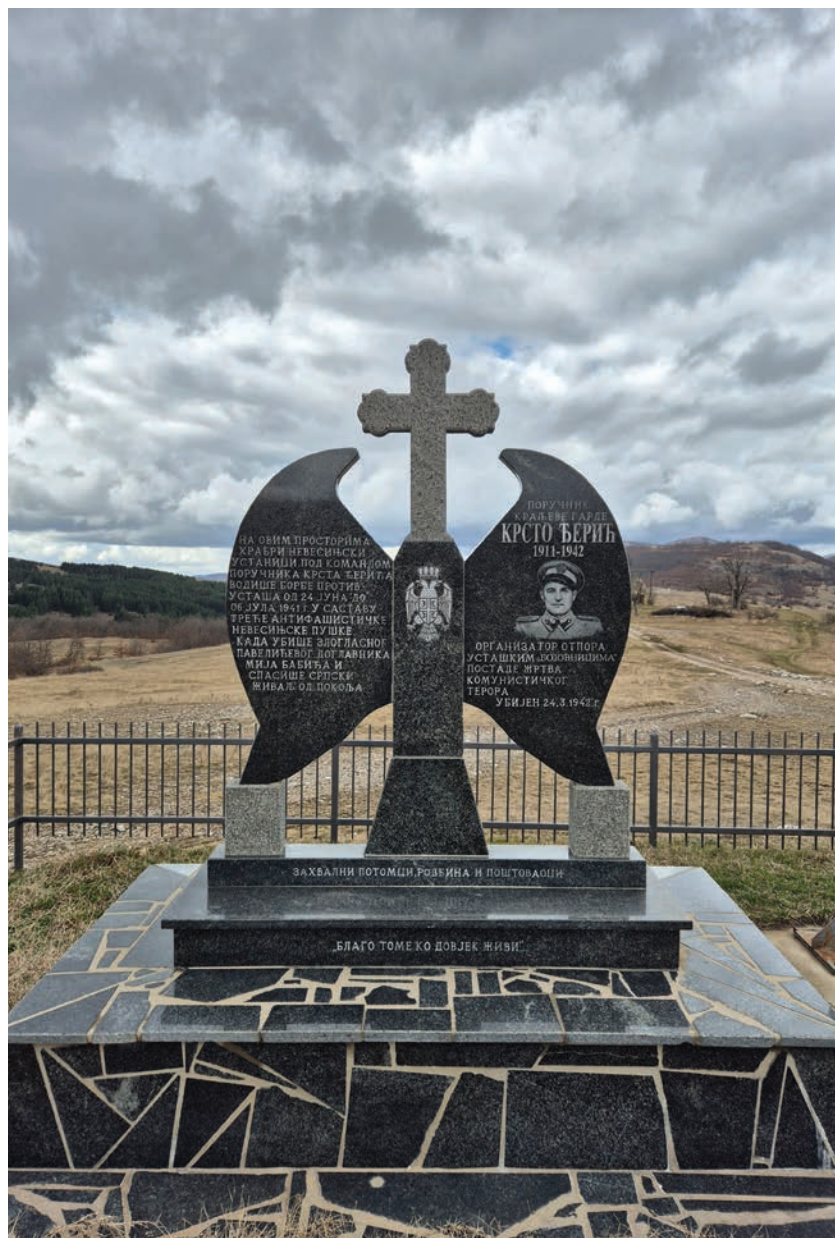
Сјоменик Крсћу Берићу на Горњој Трусини.